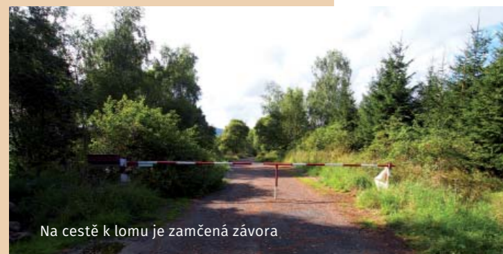
Na cestě k lomu je zamčená závora

Na místě, kde se nyní nachází zatopený lom Rotava, byl dříve vrch Kernberg, který vyčníval více než 70 metrů nad okolní terén. Jednalo se vlastně o vyhaslou sopku s horninou zvanou nefelinický bazanit, která je velmi podobná čediči. První známky o těžbě pocházejí již z 18. století, kdy se těžilo odlamováním takzvaných „kamenných varhan“, postupně se hornina těžila ze stále větší hloubky (ložisko mělo nálevkovitý tvar) až i z přírodní dráhy vulkánu v hloubce skoro 70 metrů. Těžba byla ukončena až roku 1995 z důvodu vyčerpání ložiska. Vytěžený materiál se používal hlavně na výrobu šterku, kostek a taviva.