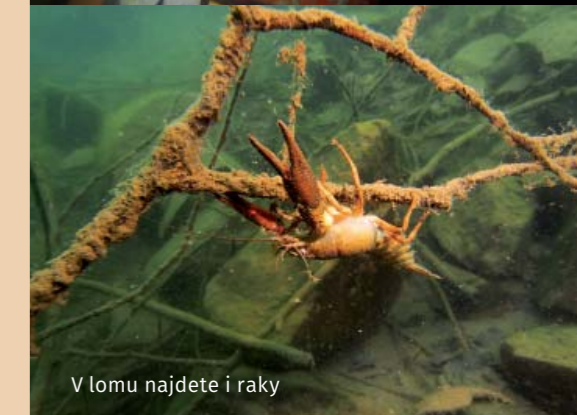
V lomu najdete i raky