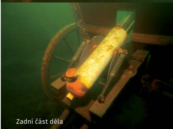
Zadní část děla