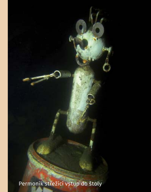
Permoník strážící vstup do štoly

Jiné zajímavosti: Voda je zde po celý rok extrémně studená a už od několika metrů hloubky má jen okolo 6 °C.