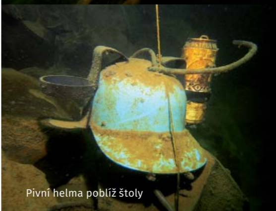
Pivní helma poblíž štoly

Důležité informace: Lom mají na 10 let pronajatý sokolovští potápěči a přístup k němu je uzamčen, potápění je tedy možné pouze po dohodě s nimi (jsou velmi vstřícní a domluvení vstupu je bezproblémové), potápění je možné vždy minimálně ve dvojici, sólo ponory nejsou z bezpečnostních důvodů povoleny.