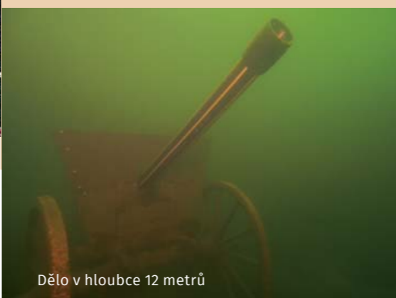
Dělo v hloubce 12 metrů