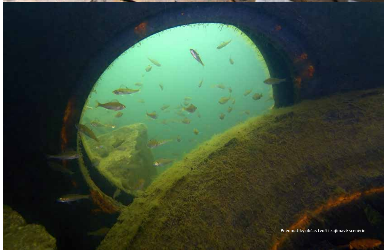
Pneumatiky občas tvoří i zajímavé scénérie