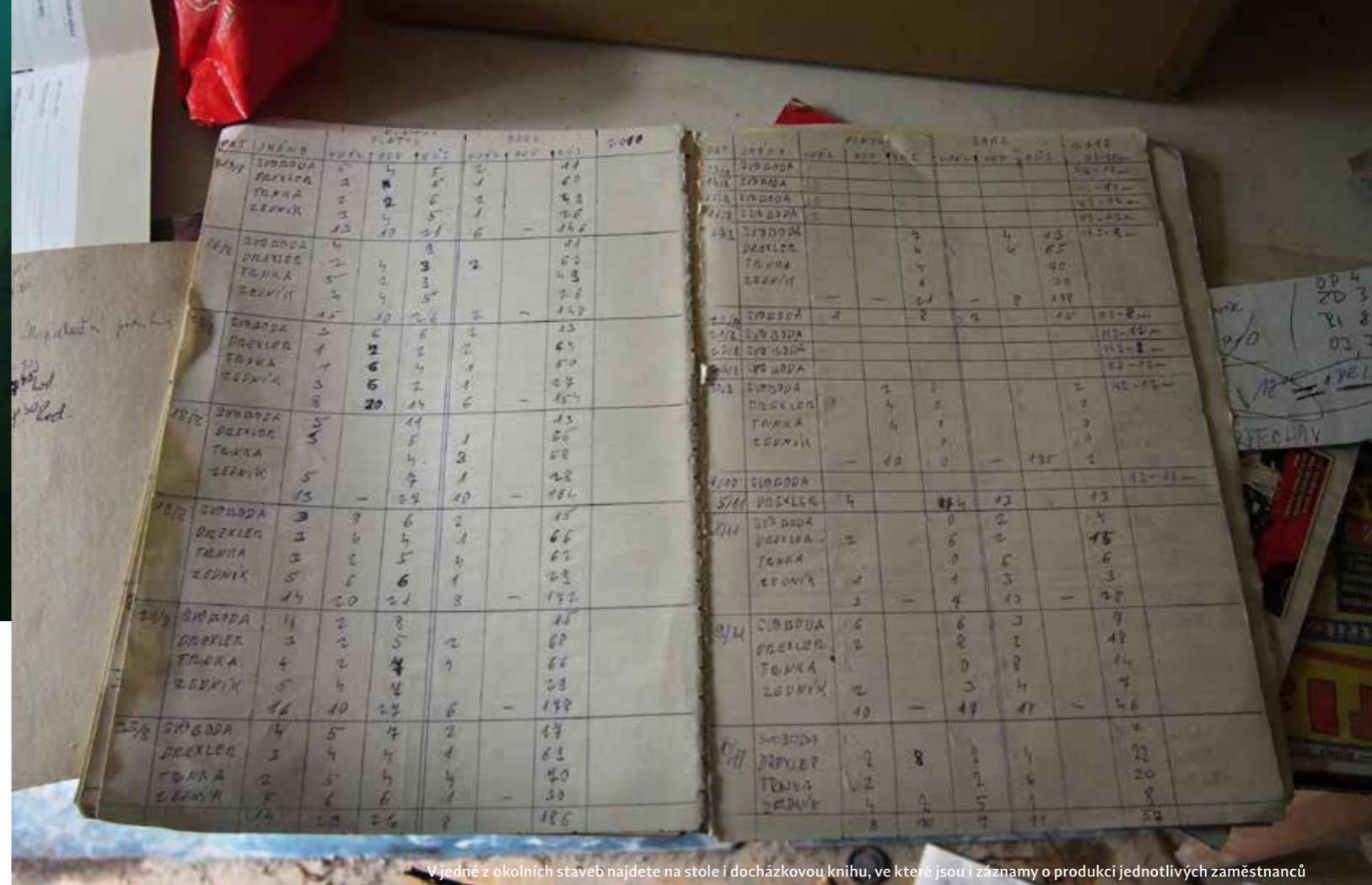
V jedné z okolních staveb najdete na stole i docházkovou knihu, ve které jsou i záznamy o produkci jednotlivých zaměstnanců

NEJBLIŽŠÍ BAROKOMORA: Nemocnice České Budějovice, oddělení úrazové a plastické chirurgie, Boženy Němcové 54, České Budějovice. ■