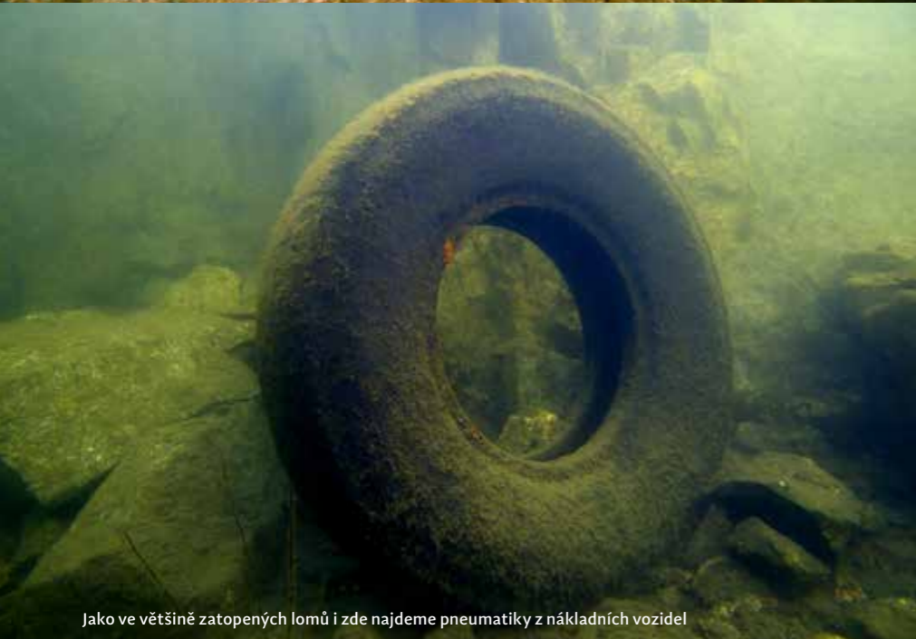
Jako ve většině zatopených lomů i zde najdeme pneumatiky z nákladních vozidel