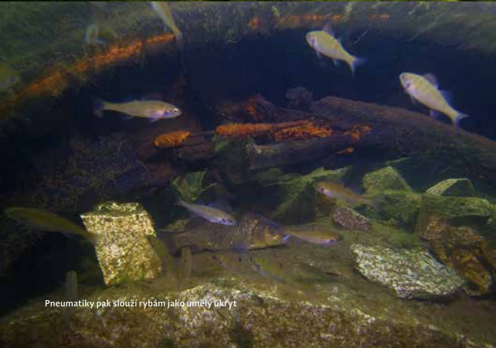
Pneumatiky pak slouží rybám jako umělý úkryt

KRAJ: Kraj Vysočina NEJBLIŽŠÍ MĚSTO: Řásná, Telč GPS: 49°12'54.43"S 15°22'40.59"