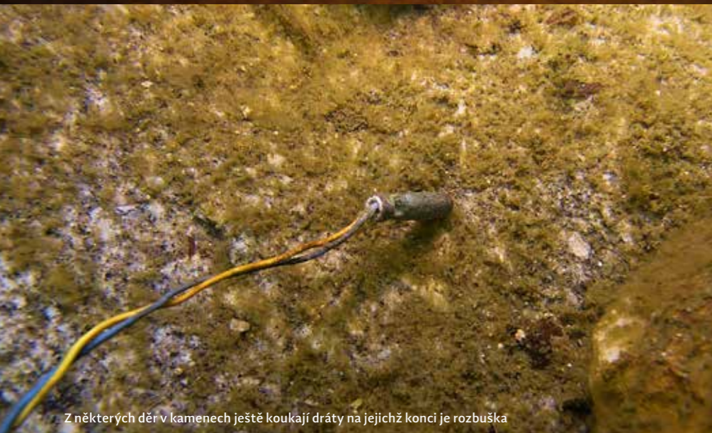
Z některých děr v kamenech ještě koukají dráty na jejichž konci je rozbuška