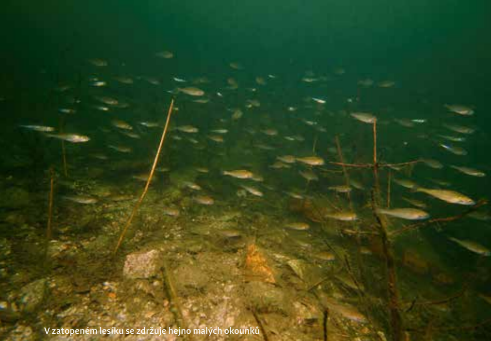
V zatopeném lesíku se zdržuje hejno malých okounků