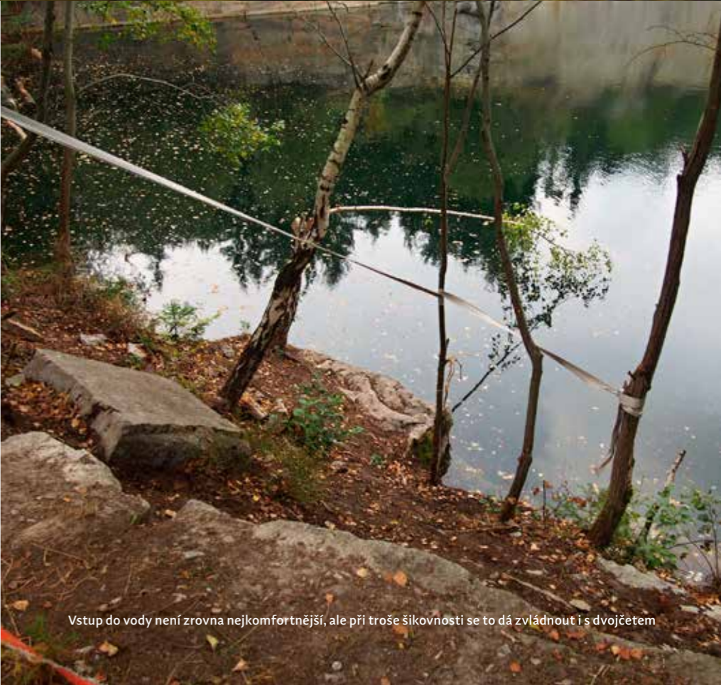
Vstup do vody není zrovna nejkomfortnější, ale při troše šikovnosti se to dá zvládnout i s dvojčetem