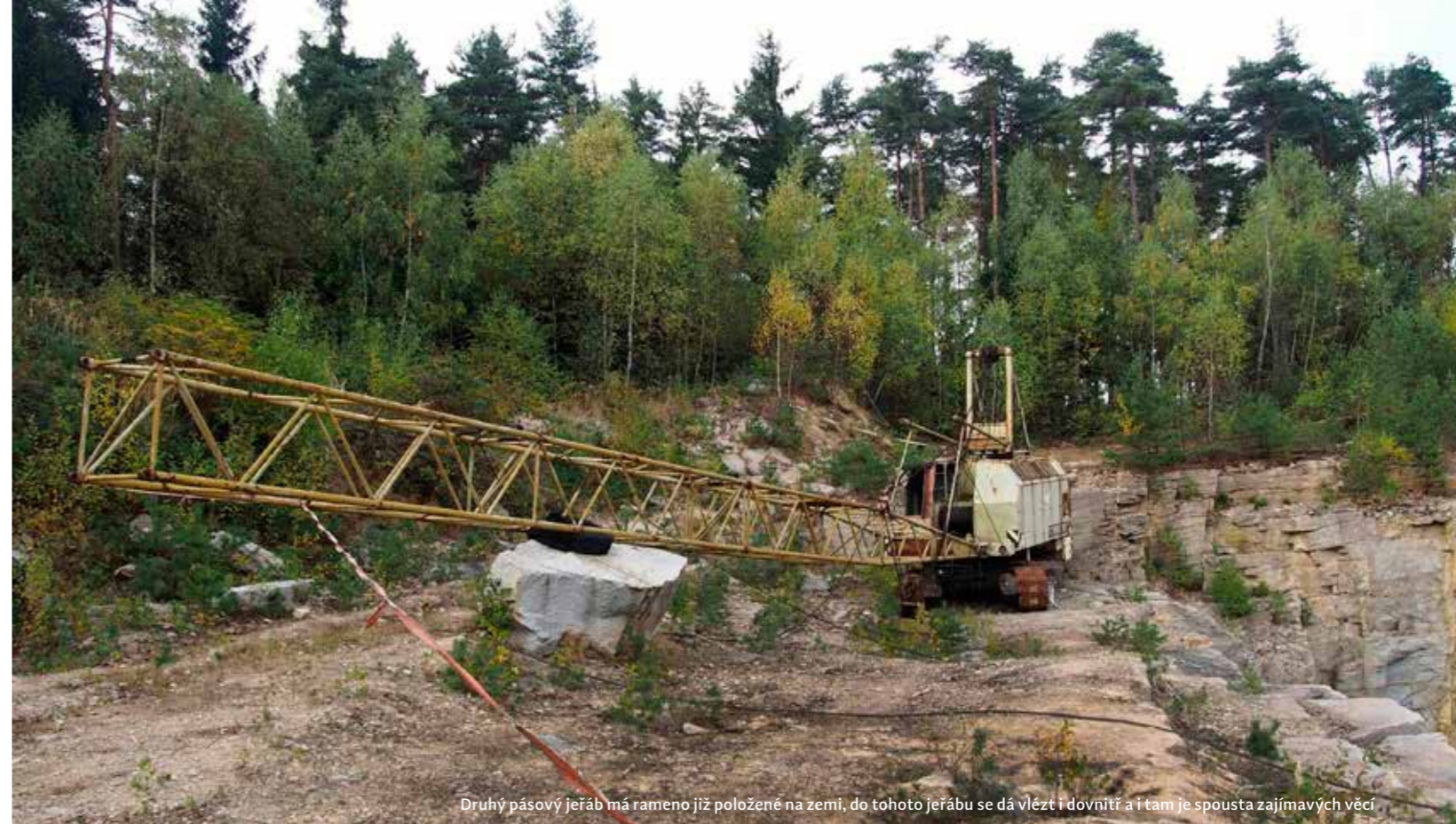
Druhý pásový jeřáb má rameno již položené na zemi, do tohoto jeřábu se dá vlézt i dovnitř a i tam je spousta zajímavých věcí

Lom má přibližně obdélníkový tvar o delší straně cca 100 metrů a kratší cca 40 metrů. Maximální hloubka je hned u jižního břehu, dle dostupných informací ji odhaduji na 15 metrů, při našem ponoru jsme se dostali jen do hloubky 12 metrů, kde již byla prakticky nulová viditelnost, ale podle historických fotografií by se měla pohybovat právě okolo 15 metrů. Do zhruba 7 metrů hloubky však byla viditelnost velmi slušná, většinou okolo pěti metrů, s přibývajícím hloubkou však rychle klesala až k nule. Přesto, že je lom zatopen teprve krátce, překvapilo nás množství ryb, které tu již můžete potkat. Hned u vstupu se u hladiny prohánělo hejno zvědavých slunek. Zhruba v polovině východní stěny je v hloubce okolo pěti metrů kamenná plošina se zatopeným lesem, zde