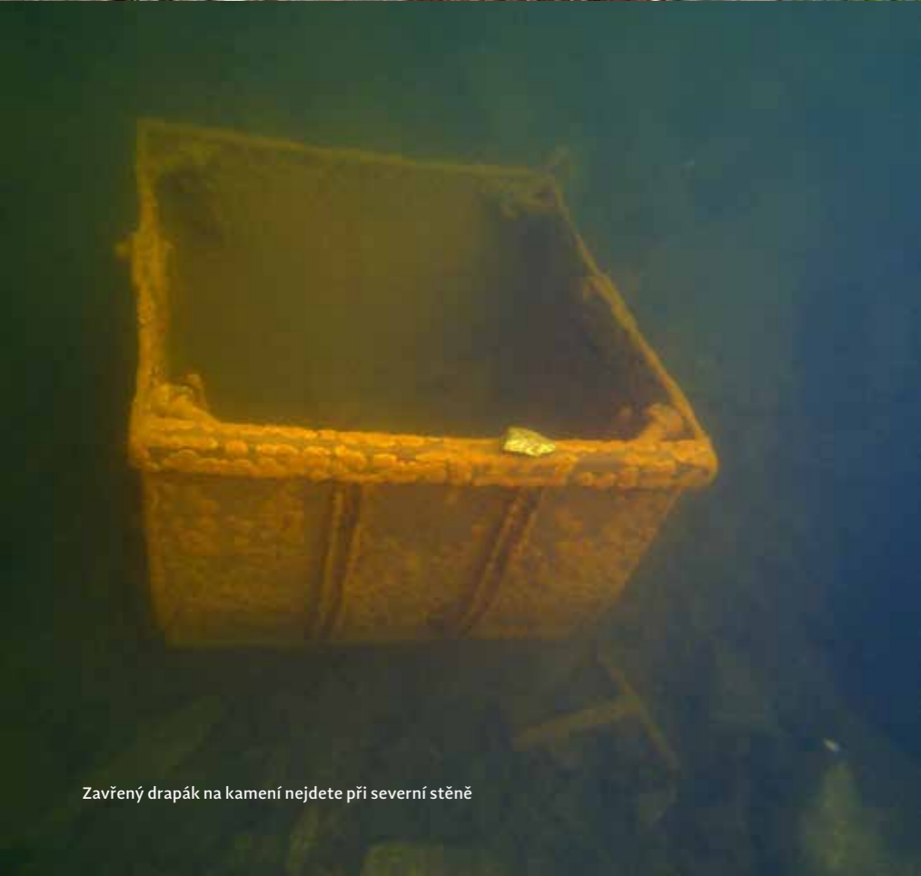
Zavřený drapak na kamení nejdete při severní stěně

V Česku nemáme příliš mnoho lomů, které by prakticky ještě nebyly potápěné. Jedním z nich je lom u Řásné na Vysočině, kde se zatím potápělo jen pár lidí, ale přitom je toho tady pod vodou celkem dost zajímavého k zhlédnutí. Začátek těžby na tomto lomu se datuje do roku 1908, lom tehdy podle svého majitele nesl název Komárkův lom, zde těžená žula pak byla používána hlavně jako obkladový materiál. Po 2. světové válce byl lom opuštěn a na jeho dně se objevilo asi dva metry hluboké jezírko. Těžba byla obnovena až po revoluci, kdy zde začala těžit firma Kavex. K ukončení těžby došlo ke konci roku 2010 a od té doby se lom začal zatápět spodní vodou. Díky tomu, že byl lom těžbou po revoluci výrazně prohlouben, nastoupala hladina vody až na dnešních zhruba 15 metrů, což už umožňuje vstup do vody, který byl při nižším stavu vody díky kolmým stěnám prakticky nemožný.