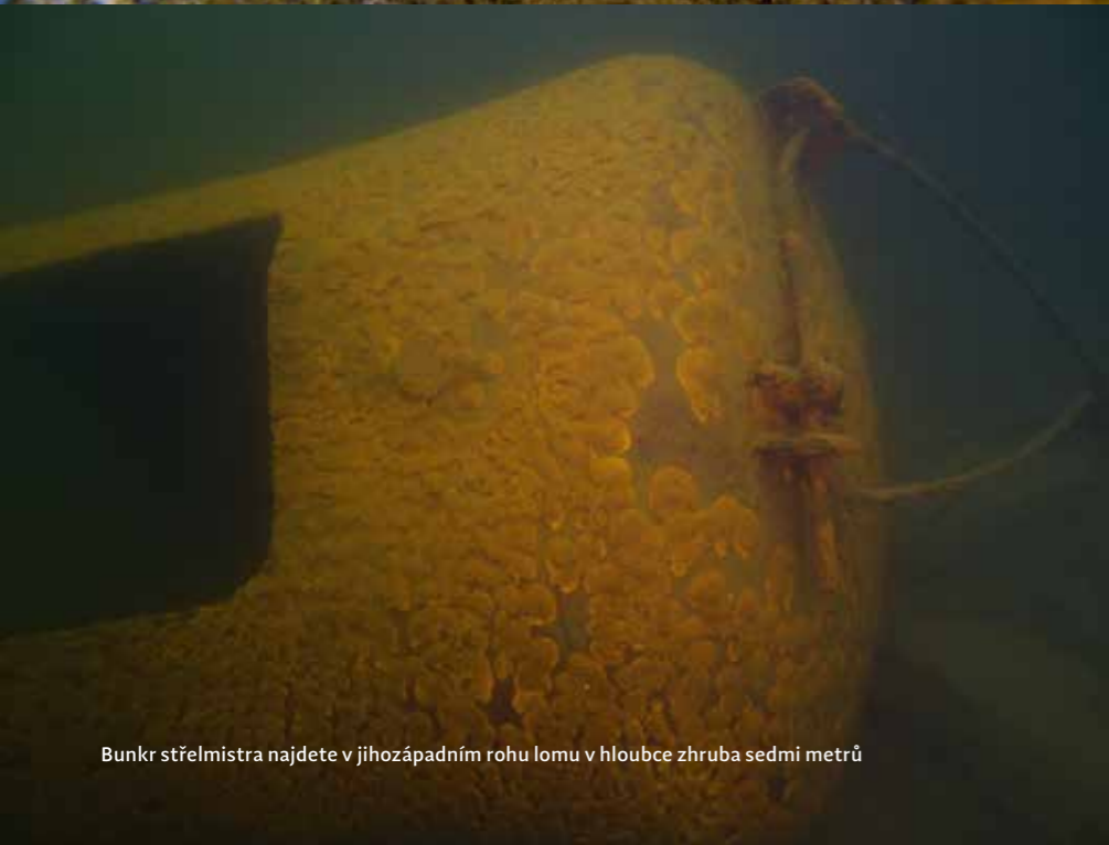
Bunkr střelmistra najdete v jihozápadním rohu lomu v hloubce zhruba sedmi metrů

jsme nejdříve potkali hejno malých okounků a následně i několik menších kaprů a karasů. Z dalších ryb jsme už narazili jenom na bělice, ale myslím, že časem se tu určitě objeví i štiky. Pod vodou můžete narazit i na spoustu pozůstatků po těžbě, nejčastěji to jsou samozřejmě velké pneumatiky, při severní stěně pak najdete velký zavěšený drapák, který nejspíše patřil k jednomu z důlních jeřábů, které dodnes u lomu stojí. V jihozápadním rohu pak naleznete železný bunkr střelmistra. Z menších věcí můžete najít například nářadí, které tu dělníci při ukončení těžby ponechali. Pokud budete koukat pozorně, najdete i nevybuchlé rozbušky.