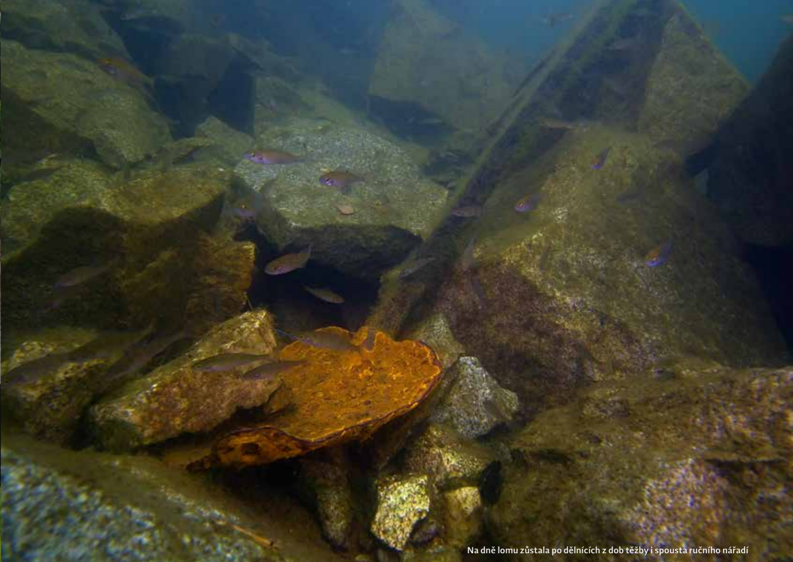
Na dně lomu zůstala po dělnících z dob těžby i spousta ručního nářadí