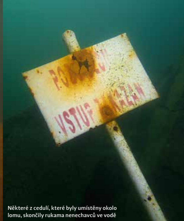
Některé z cedulí, které byly umístěny okolo lomu, skončily rukama nenechavců ve vodě