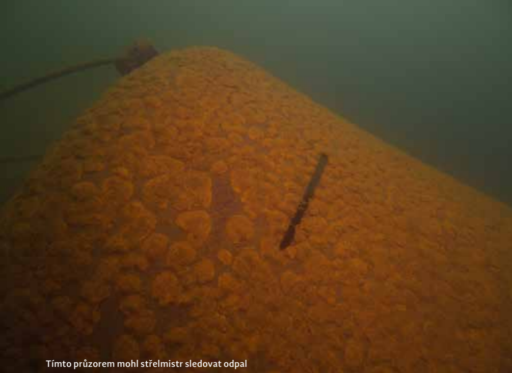
Tímto průzorem mohl střelmistr sledovat odpal