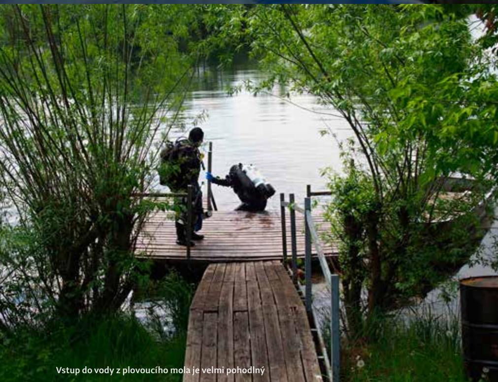
Vstup do vody z plovoucího mola je velmi pohodlný

Dnes se lokalita oficiálně jmenuje Žernosecké jezero, ve skutečnosti se ale jedná o bývalou pískovnu, která byla zaplavena spodní vodou v 50. a 60. letech. Štěrkopísek, který se zde těžil, se používal například při stavbě Slapské a Orlické přehrad. Lokalita je však zajímavá tím, že zde pod vodou skončila polovina původního pražského mostu Barikádníků. Při jeho bourání v 80. letech se jeho jednotlivé díly spouštěly na lodě (železné vany) a po Vltavě a Labi byly převáženy až do již zaplavené pískovny v Píšťanech, kde byly potopeny na dno. Potopení posledních částí mostu se však ne úplně povedlo, na dně zaplavené pískovny totiž skončila díky vlně i loď, která díly přivezla, což je vlastně pro nás potápěče dnes dobře. Podobných kuriozit tu ale můžete najít víc, například u jednoho ze tří ostrůvků můžete najít částečně potopenou betonovou loď, ano čtete správně betonovou. Právě na této pískovně se za minulého režimu testovala výroba betonových lodí.