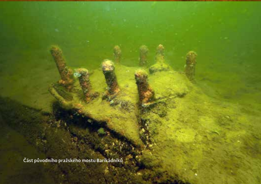
Část původního pražského mostu Barikádníků