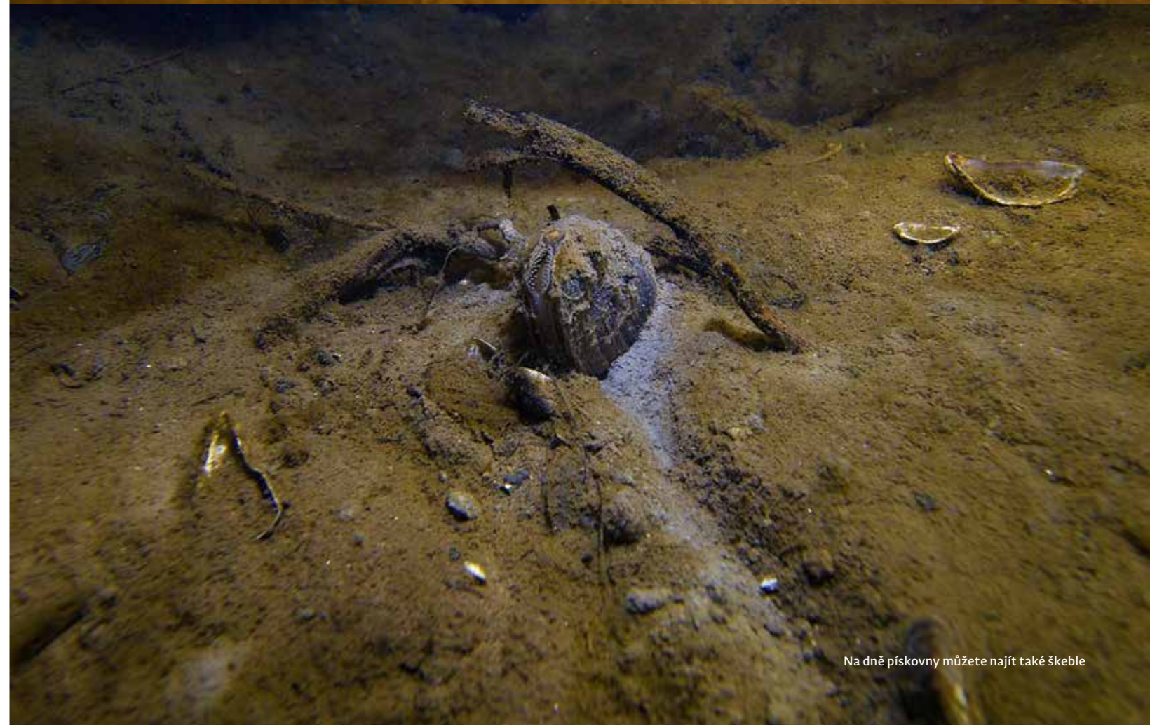
Na dně písčiny můžete najít také škeble