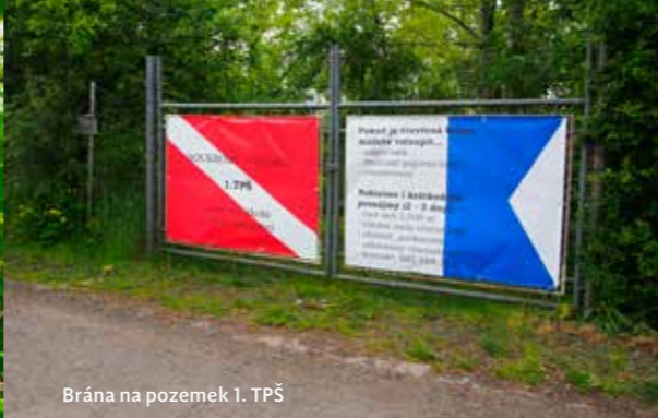
Brána na pozemek 1. TPŠ

atrakcemi. Pokud se u rozcestníku s číslem 1 dáte po levé lince, dorazíte po chvíli k vraku lodě, linka vás dovede přímo na prostředek lodě, nejlepší je tedy dát se doleva a celou loď obeplavat kolem dokola. Narazit zde můžete i na několik průlezů do podpalubí, vstup bych ale z důvodů velké kalivosti a velmi malých prostorů nedoporučoval. Hned u lodi můžete najít dva kusy mostu Barikádníků, jsou to právě ty dva kusy, díky kterým se loď potopila. Pokud budete po linkách pokračovat dál, najdete i další části mostů, vše je místními potápěči krásně vyvázano a podle přiloženého plánu se můžete velmi dobře zorientovat, každé uvázání linky je navíc označeno číslem, které má barvu podle příslušného okruhu. Pokud se sem vydáte na přelomu května a června, kdy bývá i nejlepší viditelnost, máte šanci na mostech narazit na velké množství candátů, kteří si zde dělají hnízda. Viditelnost se zde ale může změnit k horšímu během pár hodin, a to díky propojení s Labem. Pokud se na Labi zvedne hladina (například tím, že povodí pustí vlnu, aby mohla proplout nějaká větší loď), tak to prakticky vždy přináší „špinavou“ vodu, která z krásné několikametrové viditelnosti udělá hrachovku s viditelností třeba jen půl metru.