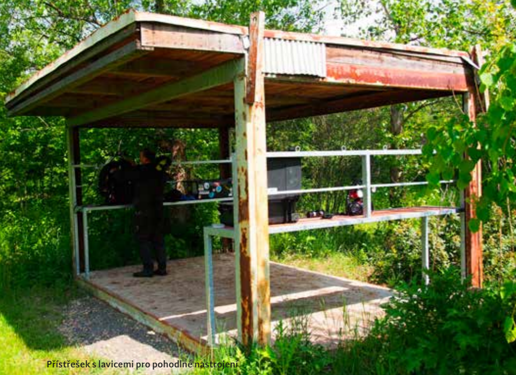
Přístřešek s lavicemi pro pohodlné nastrojení