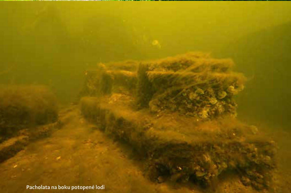
Pacholata na boku potopené lodi

NEJBLIŽŠÍ BAROKOMORA: Almedea, Masarykova 94, Ústí nad Labem ■