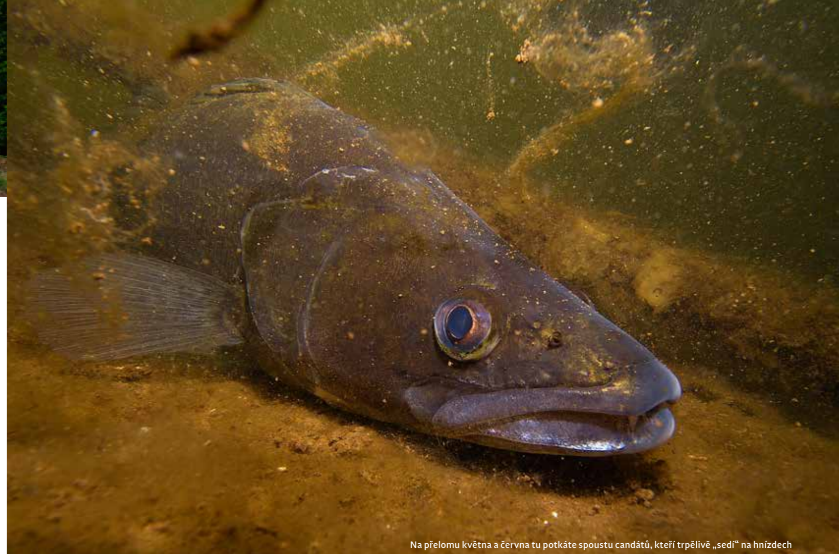
Na přelomu května a června tu potkáte spoustu candátů, kteří trpělivě „sedí“ na hnízdech