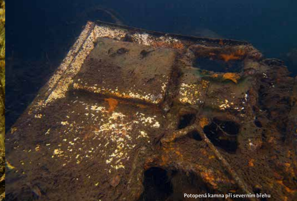
Potopená kamna při severním břehu