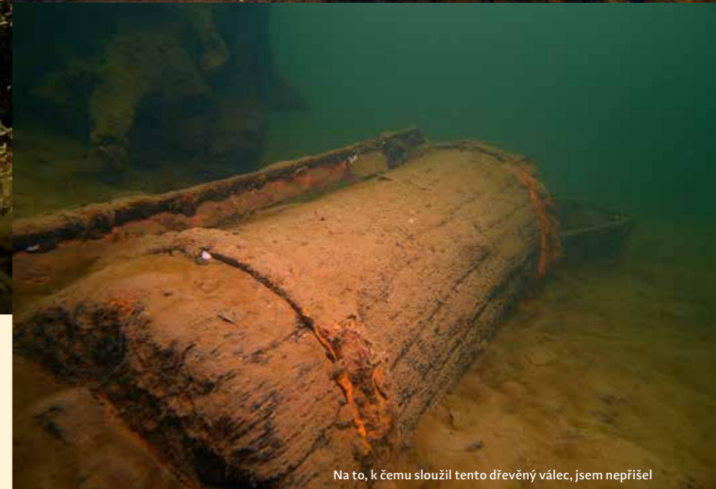
Na to, k čemu sloužil tento dřevěný válec, jsem nepřišel