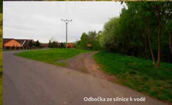
Odbočka ze silnice k vodě