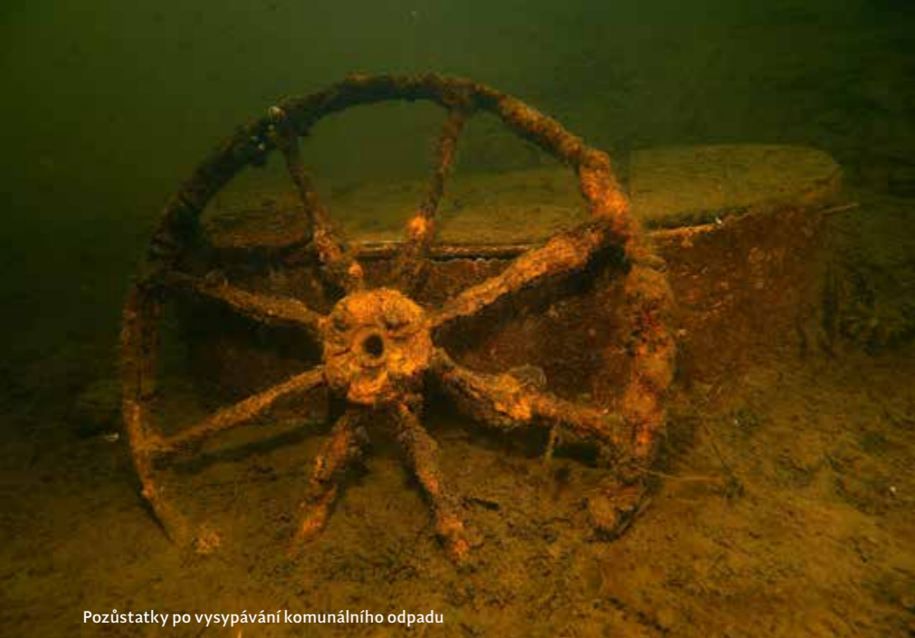
Pozůstatky po vysypávání komunálního odpadu