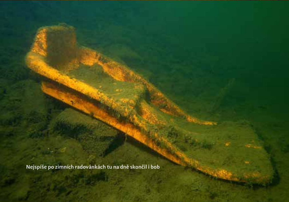
Nejspíše po zimních radovánkách tu na dně skončil i bob