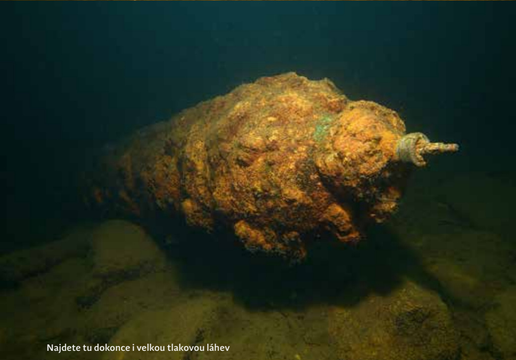
Najdete tu dokonce i velkou tlakovou láhev