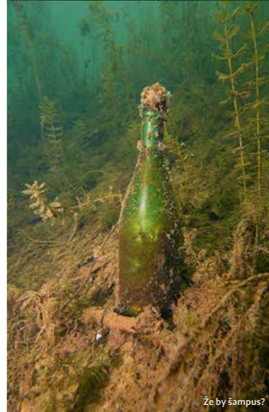
Že by šampus?