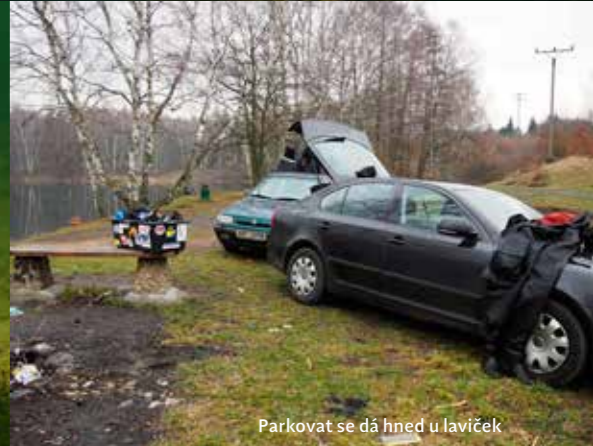
Parkovat se dá hned u laviček