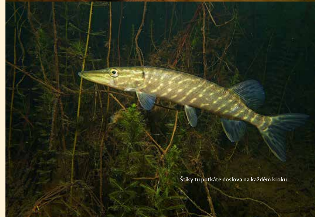
Štíky tu potkáte doslova na každém kroku

Oprám je název pro zatopené důlní dílo, a to jak povrchové, tak hlubinné, které se později propadlo. Litvínovský Oprám vznikl zatopením povrchového dolu Klement, ve kterém probíhala těžba v letech 1904–1945. V 70. a 80. letech důl sloužil jako skládka, kdy ze svahů popelářské kuka vozy vysypávaly komunální odpad z Litvínova přímo do vody. I díky tomu můžete ještě dnes pod vodou narazit na spoustu zajímavých věcí, které pocházejí z domácností okolo Litvínova.