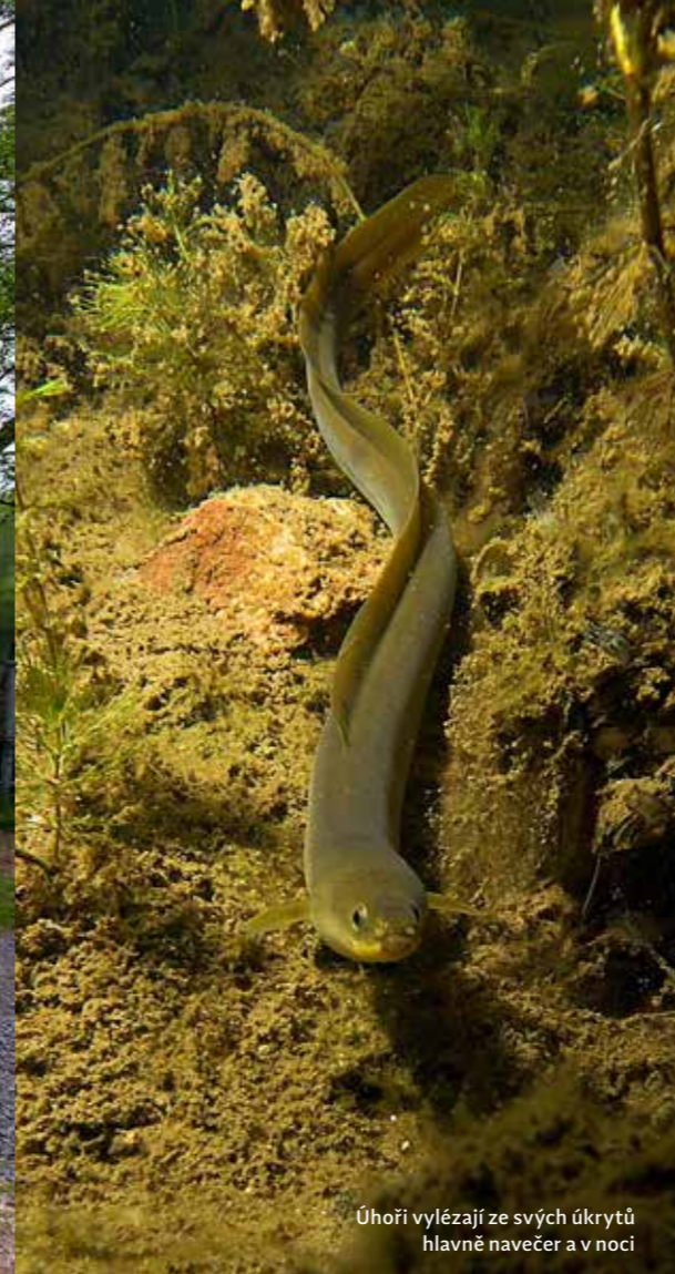
Úhoři vylézají ze svých úkrytů hlavně navečer a v noci

Od parkoviště se vám na oprám naskytne tento pohled, vpředu je vstup do vody z malé pláže