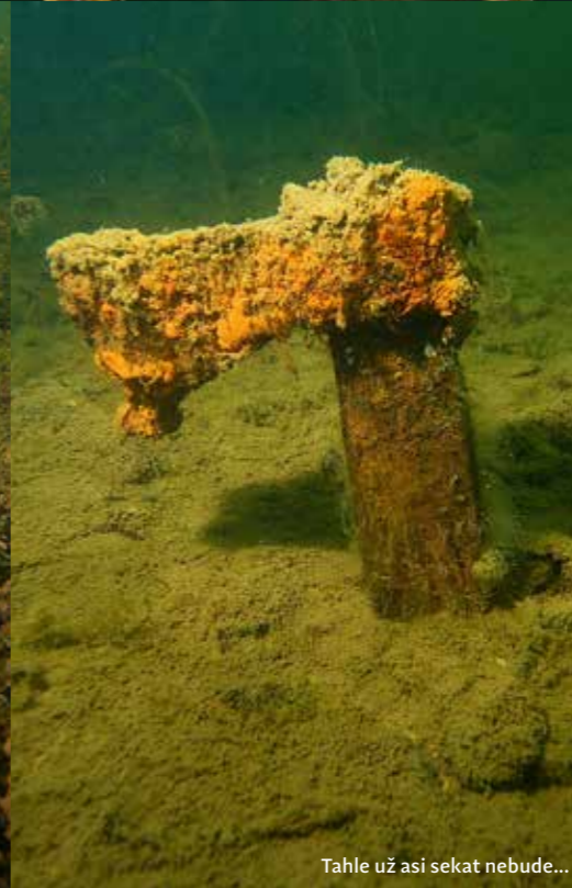
Tahle už asi sekat nebude...