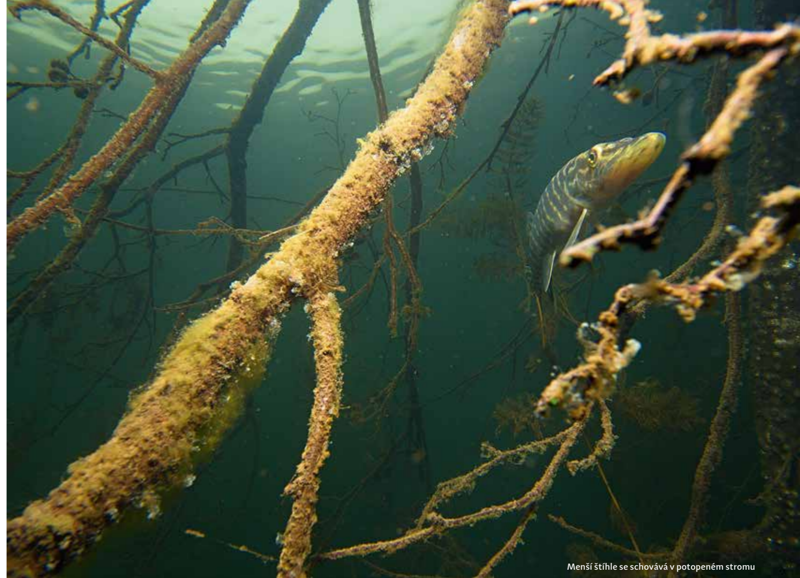
Menší štíhle se schovává v potopeném stromu

NEJBLIŽŠÍ BAROKOMORA: Ambulance hyperbarické oxygenoterapie nemocnice v Mostě, J. E. Purkyně 270/5, Most