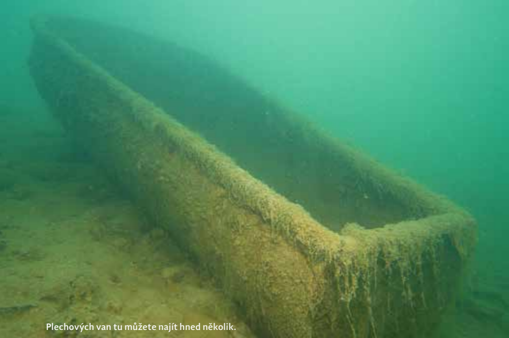
Plechových van tu můžete najít hned několik.