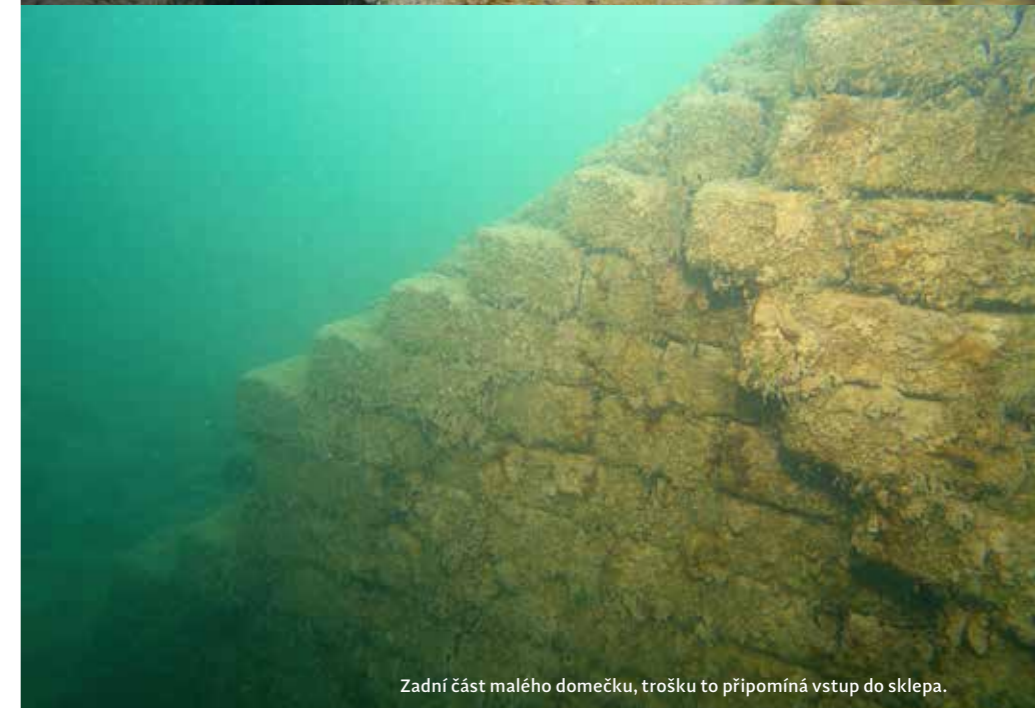
Zadní část malého domečku, trošku to připomíná vstup do sklepa.