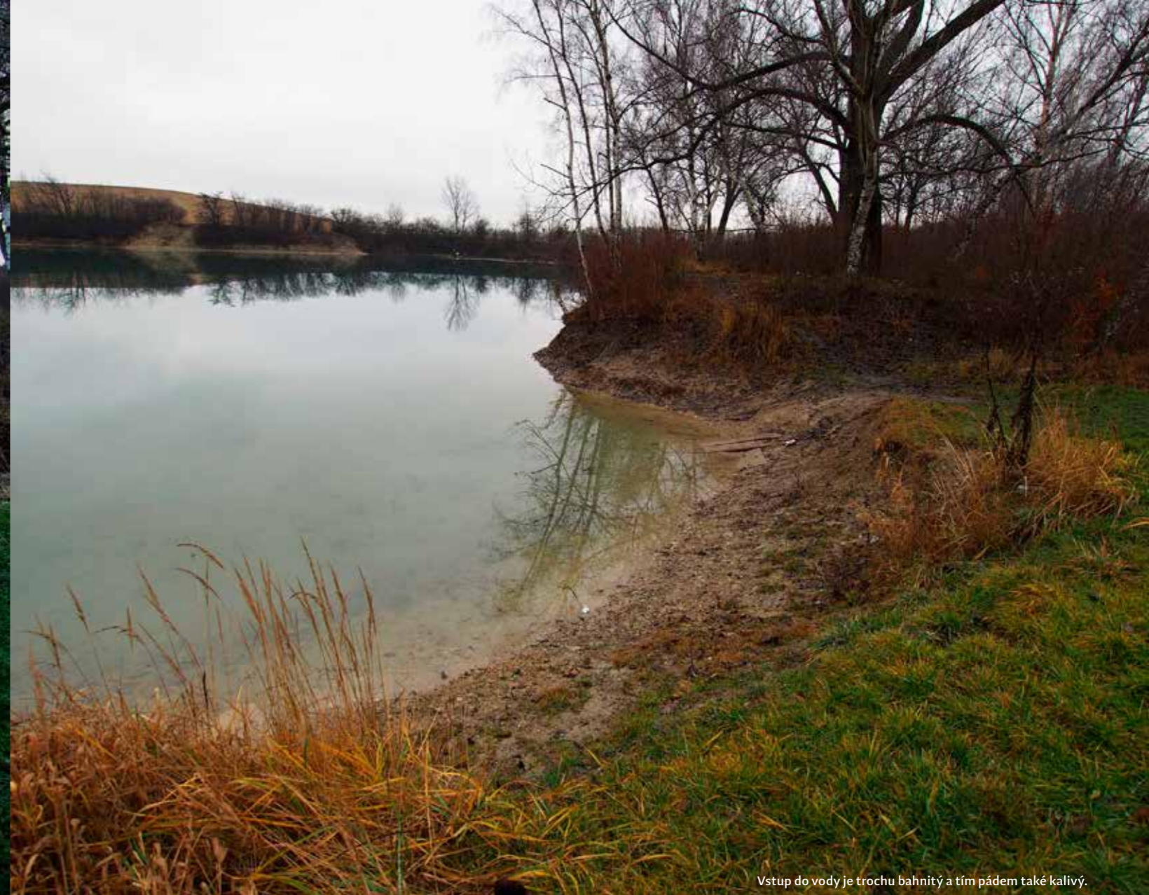
Vstup do vody je trochu bahňitý a tím pádem také kalivý.