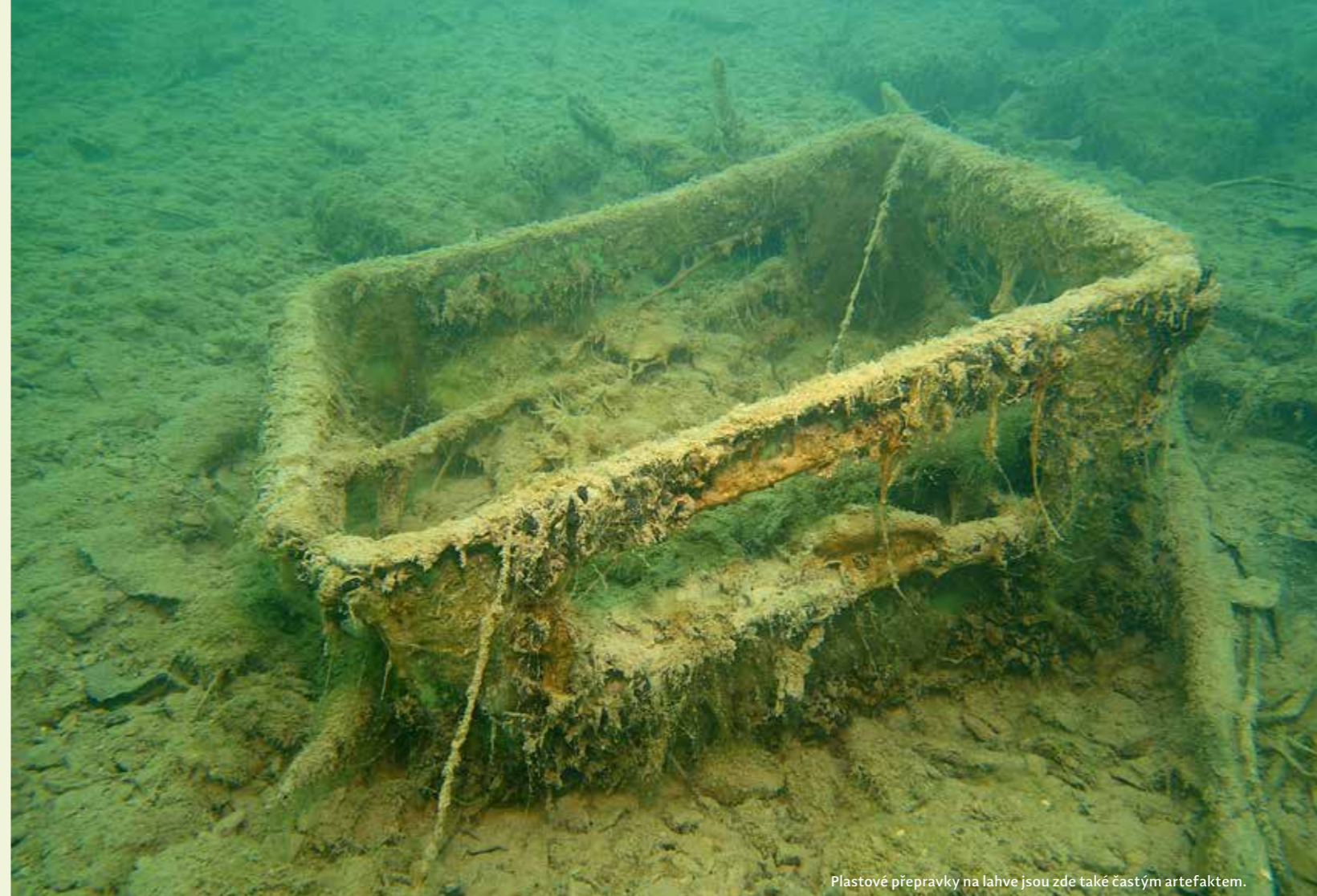
Plastové přepravky na lahve jsou zde také častým artefaktem.

NEJBLIŽŠÍ BAROKOMORA: Almedea, Masarykova 94, Ústí nad Labem ■