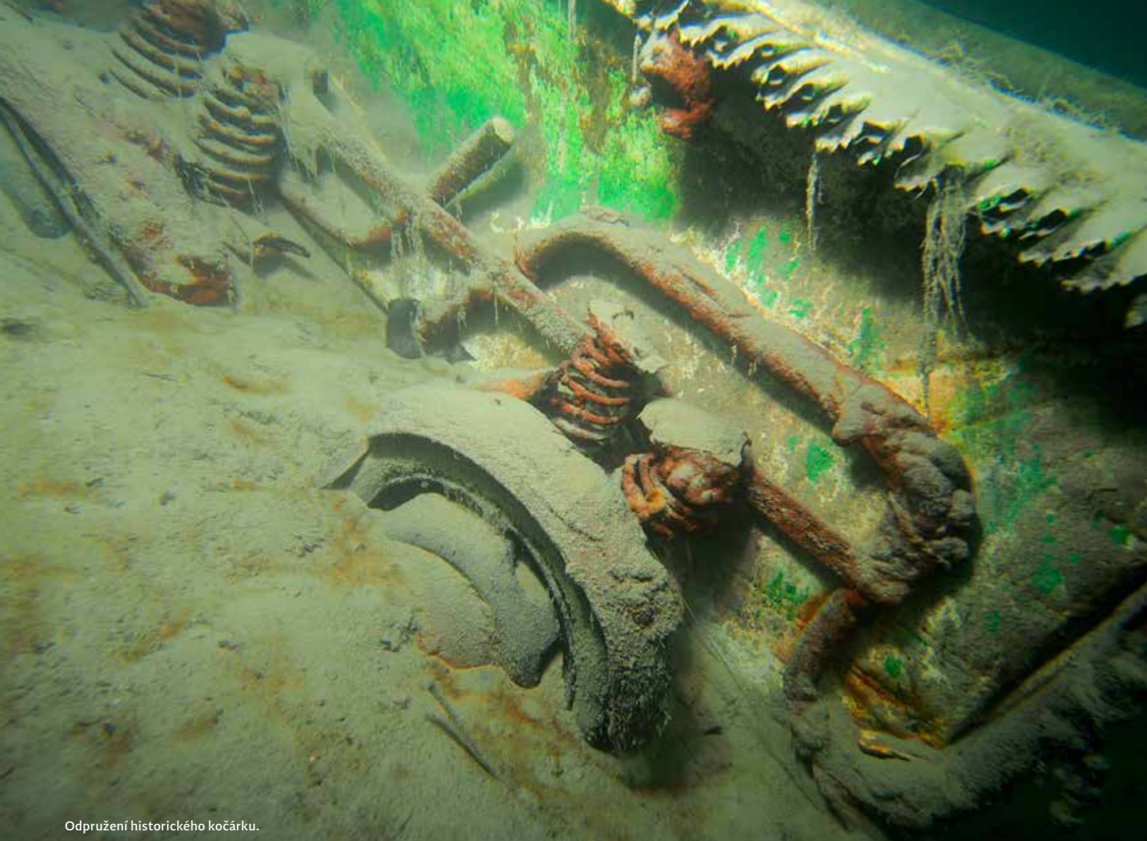
Odpružení historického kočárku.