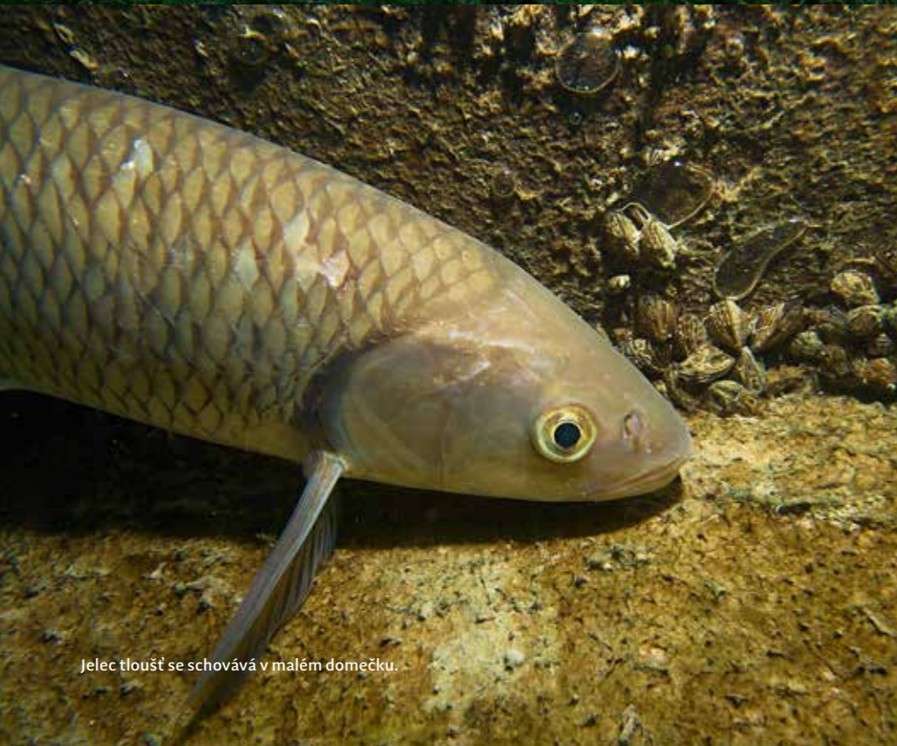
Jelec tloušť se schovává v malém domečku.

Jednu ze zatopených vápenek v Ústeckém kraji – Přítkov, jsme si představili v čísle 52, které vyšlo v únoru minulého roku. Dnes se podíváme na jednu z dalších vápenek v této oblasti u obce Lahošť. Historie povrchové těžby vápence zde sahá do dávné minulosti, v 18. století se pak místní vápenec začal vyvážet do Saska a Pruska a byl používán hlavně jako hnojivo a také ke stavebním účelům. Těžba zde probíhala až do 60. let minulého století, pak se povrchový důl začal zatápět spodní vodou. Dnes je zatopená vodní plocha oblíbeným místem pro letní relaxaci, ale neslouží jen k radosti místních obyvatel, vápenku si oblíbili i různí lapkové, kteří se zde zbavují již nepotřebného lupu. V minulosti zde bylo nalezeno hned několik ukradených vozidel či jejich části, přívěsný vozík, pokladny (samozřejmě prázdné) a na poničené SPZ zde narazíte prakticky na každém ponoru.