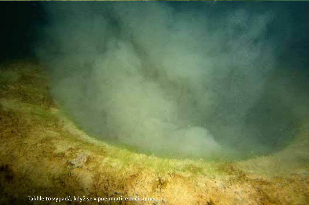
Takhle to vypadá, když se v pneumatice točí sumec.