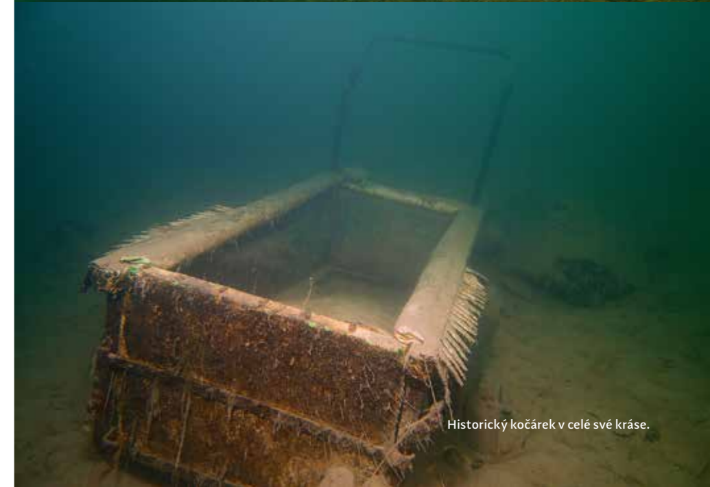
Historický kočárek v celé své kráse.