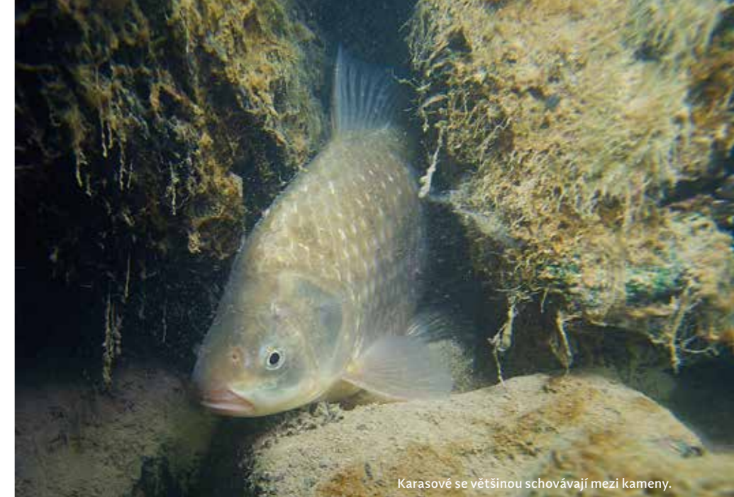
Karasové se většinou schovávají mezi kameny.