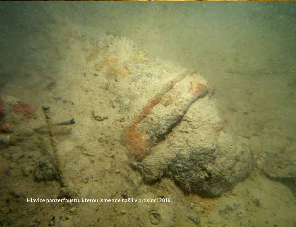
Hlavice panzerfaustu, kterou jsme zde našli v prosinci 2016.

Pokud budete chtít obeplavat celou vápenku a nezabloudíte přitom, tak vám to volným tempem zabere něco přes hodinku.