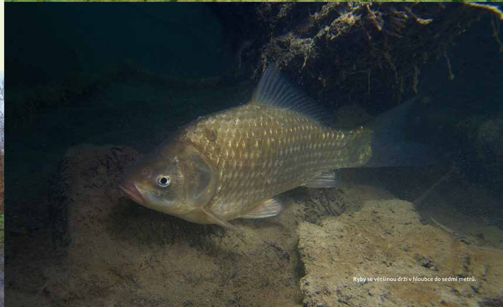
Ryby se většinou drží v hloubce do sedmi metrů.