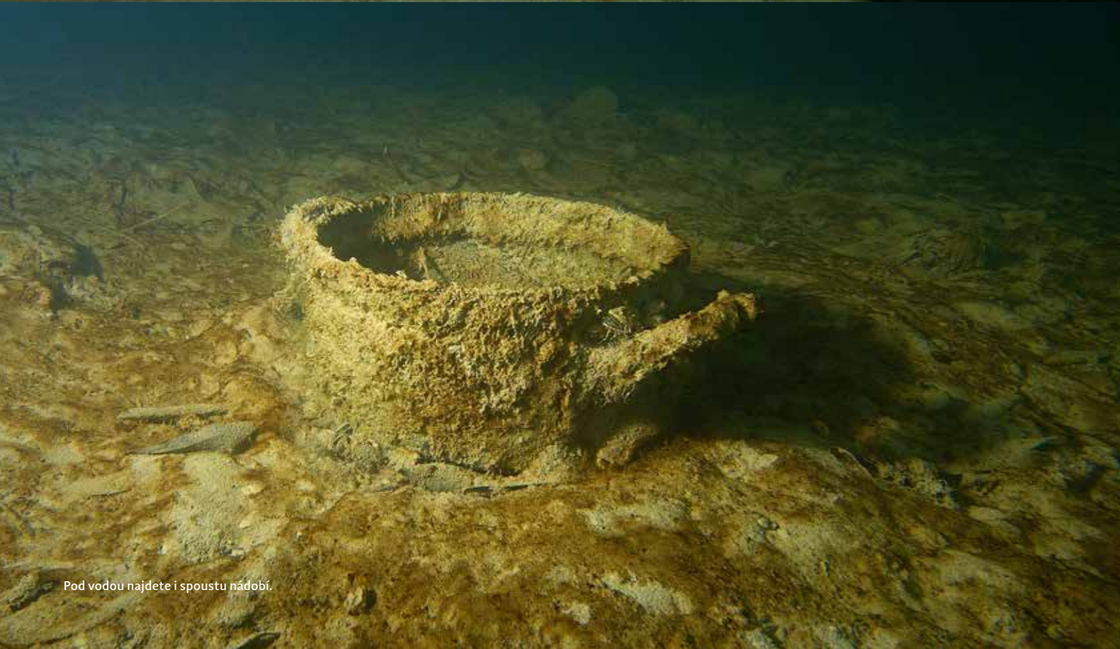
Pod vodou najdete i spoustu nádobí.

MOŽNOST PARKOVÁNÍ: ano zdarma, na louce kousek od vody