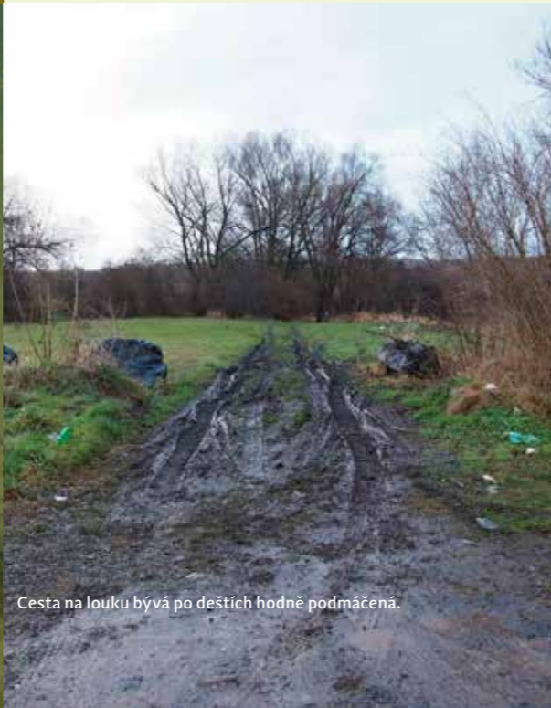
Cesta na louku bývá po deštích hodně podmáčená.